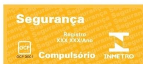
Figura 1 – Formato e dimensões do Selo de Identificação da Conformidade.

1.2 Para os utensílios que possuam revestimentos antiaderente deve ser utilizado o Selo de Identificação da Conformidade conforme a Figura 2 a seguir, devendo ser apostado no produto ou na embalagem de forma impressa ou de adesivo, de forma clara, visível ao consumidor para sua decisão de compra.